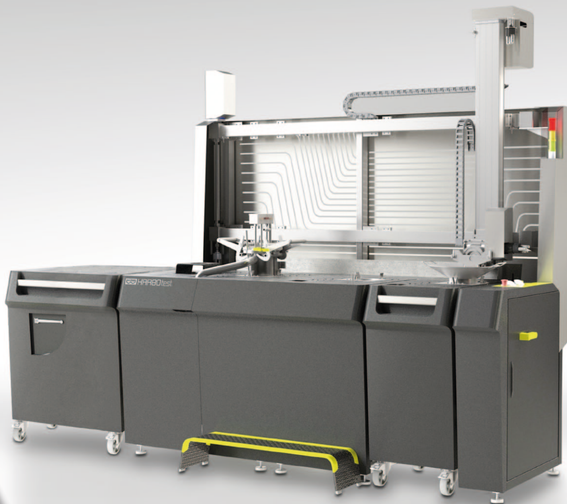
STANOWISKO LABORATORYJNEGO KOKSOWANIA